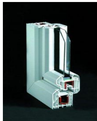
Plus Tec premium