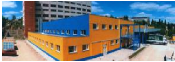
г.Харьков, ул.Рудика 1А

ООО “Дрезднер-Фенстербау Украина” является дочерним предприятием крупного немецкого производителя металлопластиковых оконных систем – компании “Dresdner-Fensterbau Medingen GmbH”.