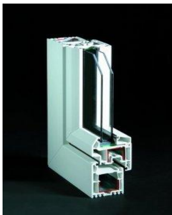
Plus Tec classic

3) Трёхкамерная система Plus Tec classic и пятикамерная система Plus Tec premium Количество камер и монтажная глубина профиля: трёхкамерный - 60 мм (Plus Tec classic), и пятикамерный – 72 мм (Plus Tec premium).